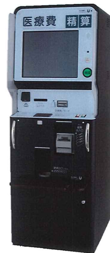
1階ロビー設置の自動精算機

精算機では、診察券を差し込むか、 受付票のバーコードをかざして精算をすることが できます。